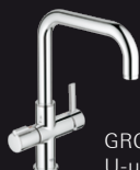
GROHE Red® Duo U-uitloop