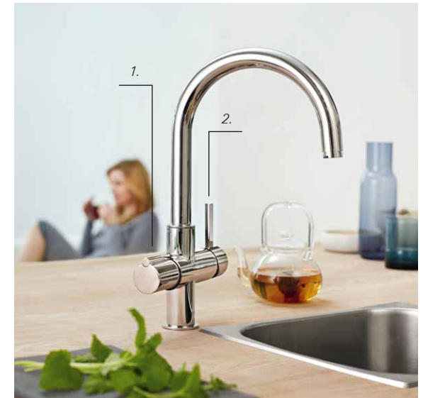
Grohe Red® grepen: 1. Kokend heet water 2. Koud, warm en gemengd water